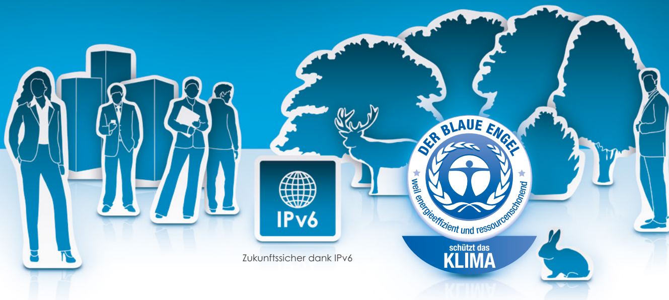
Zukunftssicher dank IPv6

Energieeffizient und ressourcenschonend: Der Blaue Engel für unsere COMcompact 5200/5200R.